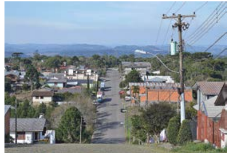
Ao mesmo tempo em que resguarda o sossego, Bairro Vindima é a casa de diversos eventos, como o Parque da Vindima.

O Vindima conta a Escola Municipal 1º de Maio e o Parque Natural São Francisco de Assis. O bairro não possui igreja, as festas, missas, aulas de catequese e reuniões são realizadas no salão comunitário, dedicado a São Francisco de Assis, padroeiro que recebe uma festa anualmente em outubro. Uma pequena praça, com quadra e alguns brinquedos infantis, fica em meio às casas. No Vindima há ainda a Igreja Congregação Cristã no Brasil e o seu perímetro urbano faz limite com a Avenida 25 de Julho e os bairros Centro, São José e Vêneto.