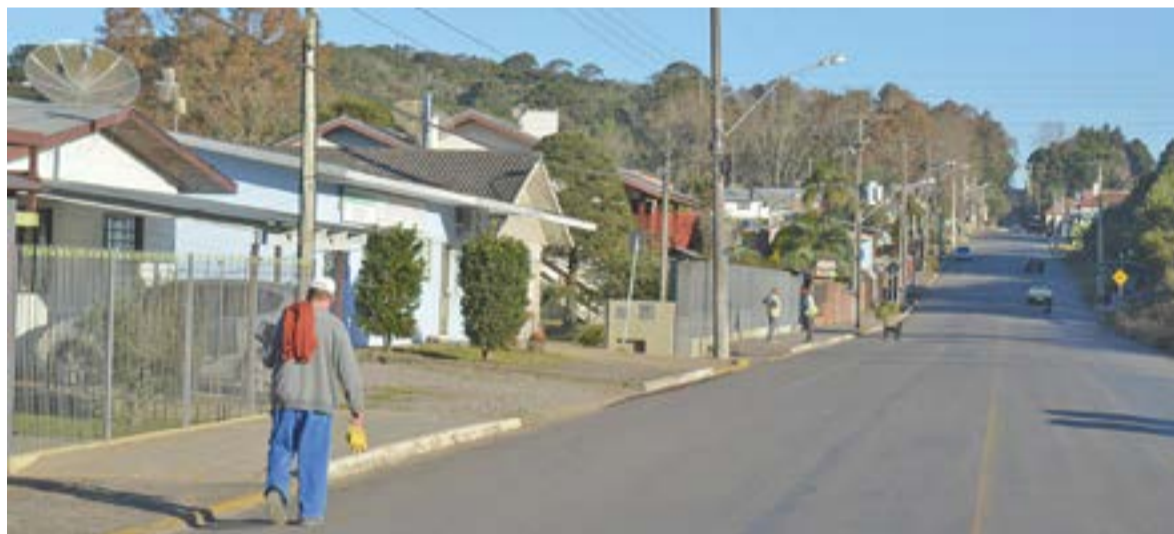
Nova Roma é um dos principais destinos para novos moradores, desenvolvendo um perfil de expansão habitacional.

paroquial, cemitério, a Unidade Básica de Saúde Dr. Antonio Matias Falavigna e a Escola Estadual Antônio Soldatelli, além da sede do Centro Empresarial. O bairro fica a 4km do Centro do município. A Rua Antônio Soldatelli, principal ligação, foi nomeada em 1997 e faz alusão ao casarão da família Soldatelli, um dos mais antigos patrimônios históricos ainda resguardados no município. O bairro tem seu limite com os bairros Vêneto, São José e Morada do Camping.