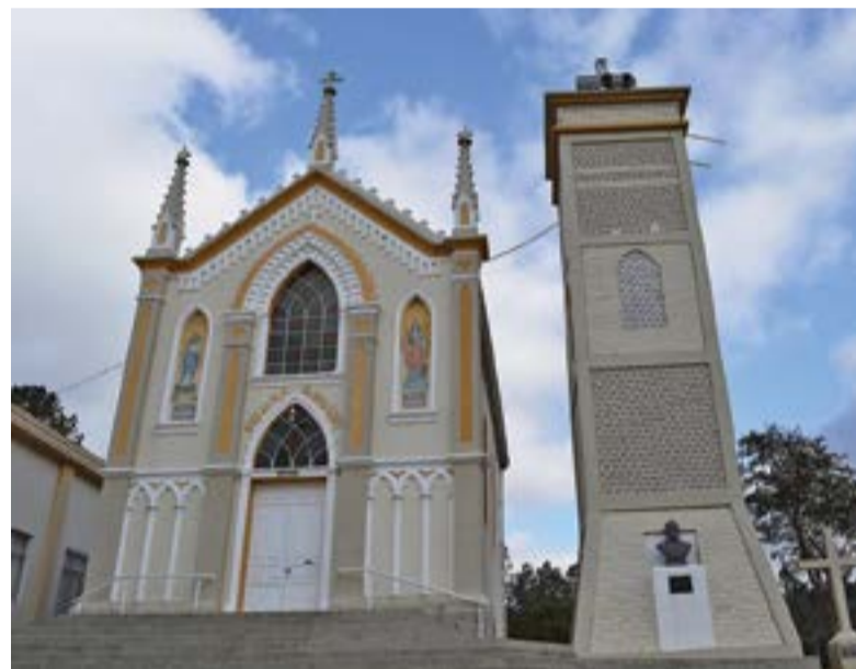
Igreja Nossa Senhora do Rosário, em Nova Roma.