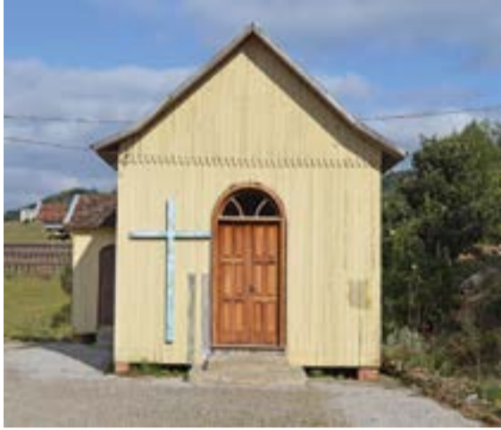
A comunidade realiza anualmente, no mês de maio, uma festa em honra a Nossa Senhora do Bom Conselho.

Conhecida como comunidade de Nossa Senhora do Bom Conselho, antigo Travessão Lagoa Bela, desde outubro de 2017, com a aprovação da lei municipal, a área passou a denominar-se bairro e, de acordo com levantamentos do Jornal O Florense , a partir de dados do Instituto Brasileiro de Geografia e Estatística (IBGE), conta com aproximadamente 90 famílias. Localizado na Região Norte de Flores da Cunha, a origem do nome Lagoa Bela tem várias versões. Algumas dizem que foi dado devido a uma grande lagoa que havia no terreno da família Falavigna, outras explicam que foi em função da grande quantidade de lagoas existentes antigamente no local.