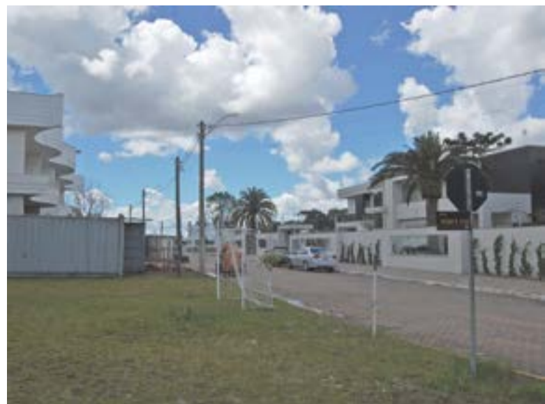
Criado recentemente, Bairro Vêneto é majoritariamente um local de moradias.

Ainda tem poucas residências e o local tende a se desenvolver como área residencial. Seu perímetro urbano faz limite com o bairro Vindima e, em uma pequena extensão, com Nova Roma.