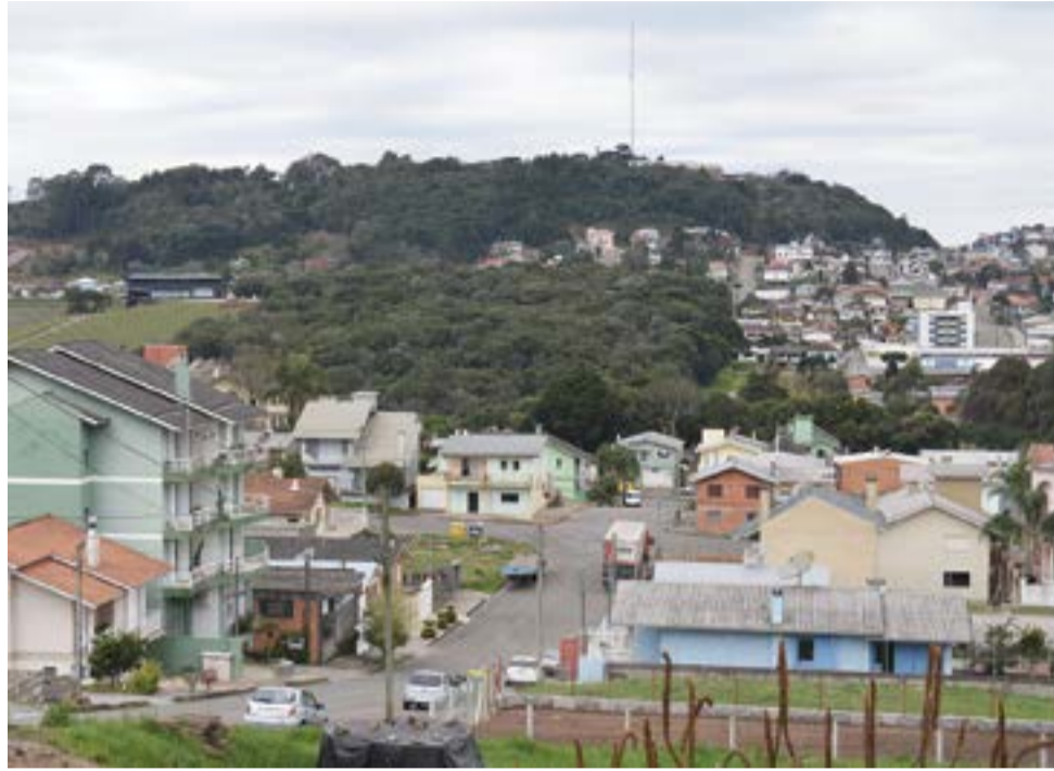
Bairro Granja União se originou do Aparecida e atualmente seus moradores se mobilizam pela construção de uma igreja.

O Granja União faz limite com a ERS-122, a Avenida 25 de Julho e os bairros Aparecida e Centro.