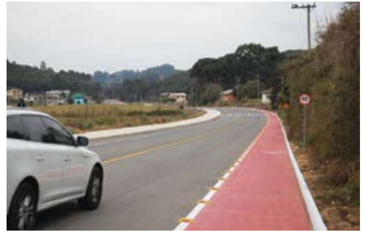
Bairro Lagoa Bela inaugurou em agosto de 2017 a pavimentação de seu principal acesso, que conta ainda com ciclovia.

Em 1939 foi inaugurada a igreja de madeira com o objetivo de abrigar a imagem de Nossa Senhora do Bom Conselho e também de Santa Ana e Santa Lúcia. Em 2005, devido a depredações, a capela foi transferida para o loteamento Santa Lúcia, junto ao atual salão comunitário. Anualmente, no mês de maio, é realizada uma festa em honra a Nossa Senhora do Bom Conselho. Recentemente, o bairro recebeu uma melhoria solicitada pela comunidade há anos – o asfaltamento de 2km até o entroncamento com a ERS-122. Lagoa Bela fica a cerca