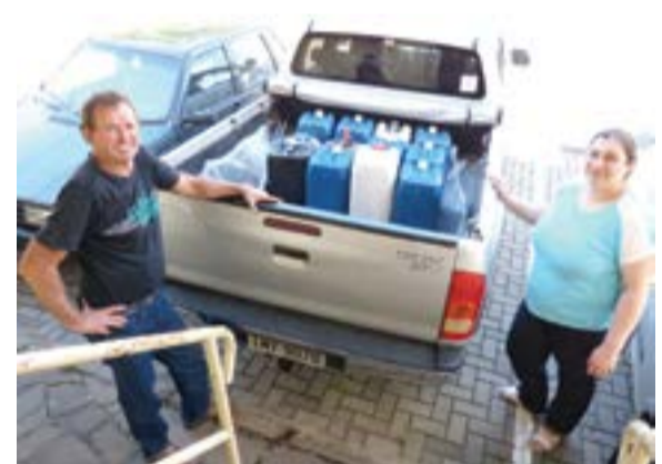
Prefeitura participa do projeto 'Mais vida para todos' do Rotary Club.

entupimento e o rompimento da tubulação da rede de esgoto. Para evitar esse dano, o projeto incentiva a população a dar um destino correto. O processo para reutilização do óleo é simples: em vez de jogar o produto no ralo da pia ou em outro ambiente, a população deve colocá-lo em uma garrafa pet e entregá-la no ponto de recolhimento, na prefeitura. O óleo de cozinha pode ser reciclado e transformado em diversos produtos, como resinas para tintas, sabão, detergentes, ração e biodiesel.