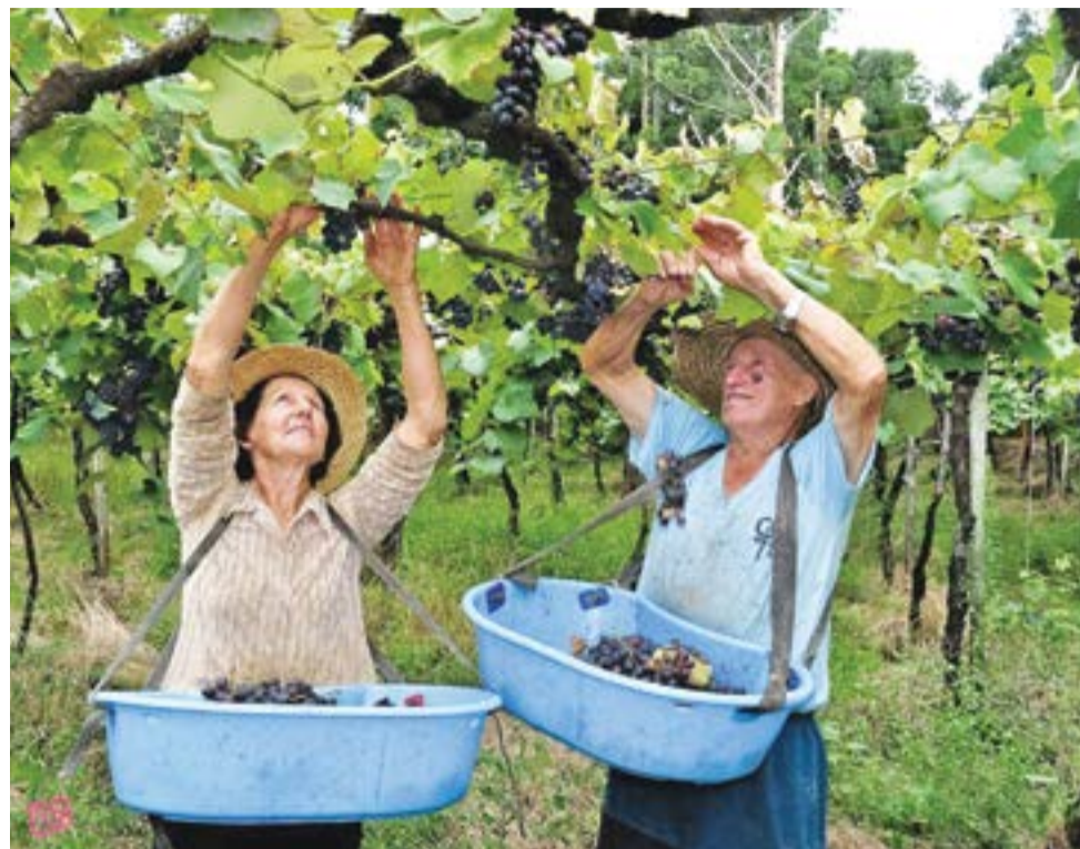
Estimativa é de que 30% da safra de Nova Pádua fora colhida até o dia 25.

mais cedo e deverá ser 25% menor do que a registrada em 2017 em Nova Pádua. Segundo o secretário da Agricultura e Meio Ambiente, Samoel Smiderle, a colheita está em 30% e a expectativa é que a qualidade se mantenha, apesar do granizo registrado no final do ano passado e das chuvas dos últimos dias. “As chuvas prejudicaram um pouco a sanidade da fruta e baixaram a graduação, mas no geral a uva continua boa”, explica.