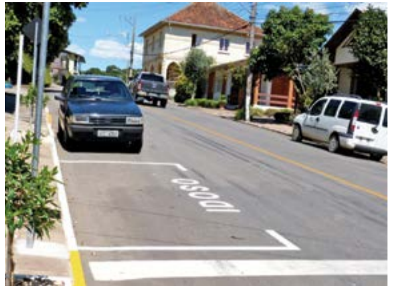
Vagas especiais foram criadas na área central do município.