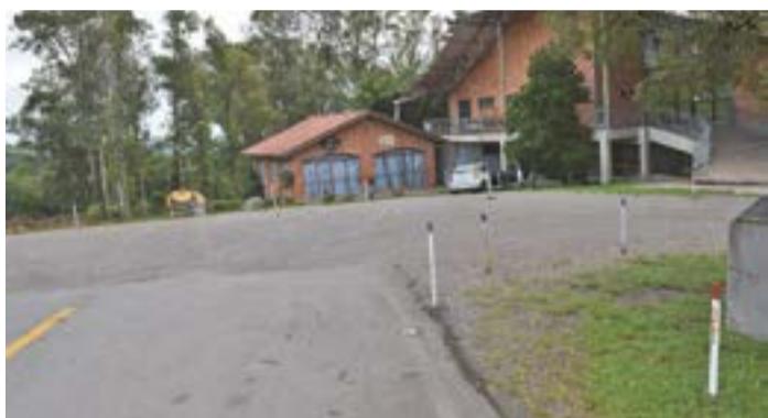
Local está demarcado para ações a serem desenvolvidas.