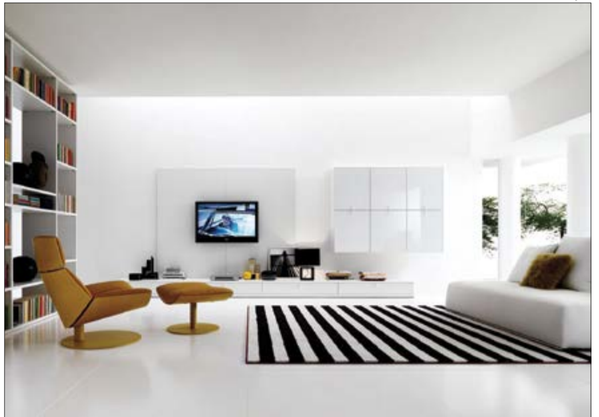
A riqueza de ambientes minimalistas estará nos visuais leves com detalhes contrastantes.

Entre um cantinho e outro, os manuscritos aparecem para nos lembrar de que nem tudo é toque de teclado ou touch screen . Isso também faz parte da intelectualidade na decoração e no sentimento de reviver experiências de forma mais humana e menos virtual. Esses elementos remetem à realidade e o lado tangível que 2018 vai nos fazer refletir. A natureza real e menos poluição visual fazem parte do conceito, e aparecem também no design, na moda e no comportamento.