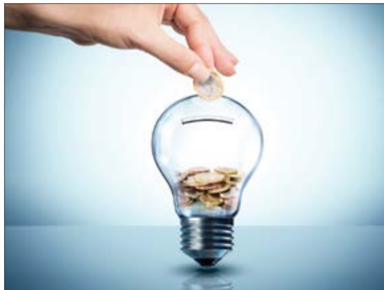
Mudanças simples na rotina podem ajudar a evitar gastos excessivos.

É importante lembrar na hora de comprar aparelhos elétricos que eles devem ser identifica-